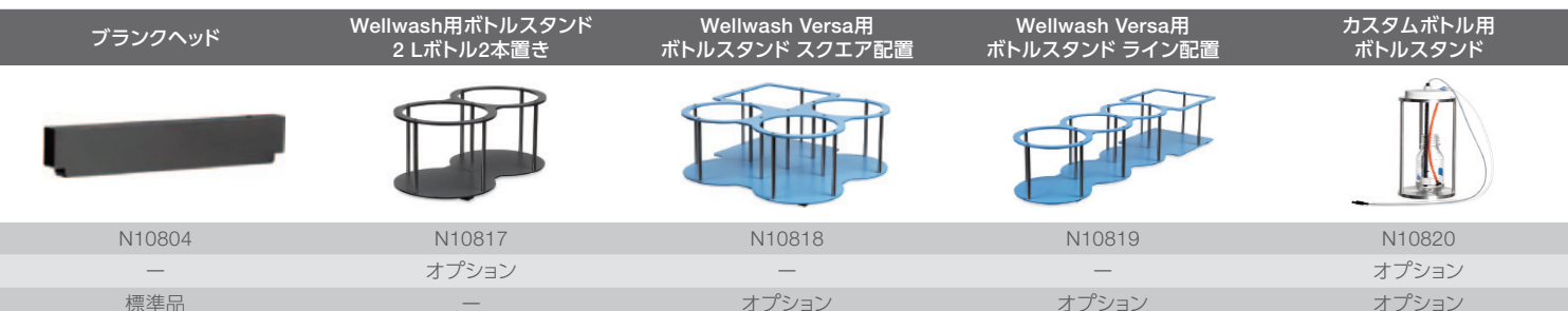
4L ウォッシュボトル