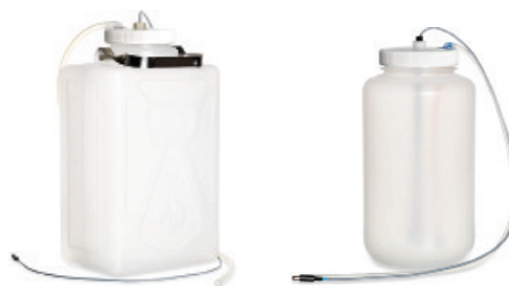
9L ウェイストボトル