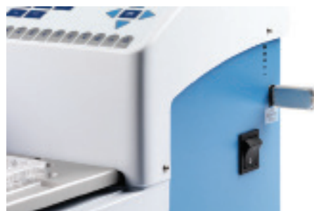
USB メモリでプロトコルの共有やログ出力が可能