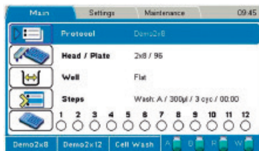
Wellwash ユーザーインターフェース メイン画面