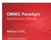
OMNIC Paradigm ソフトウェア