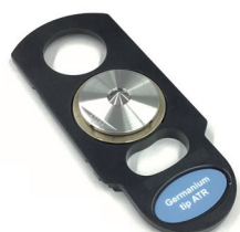
顕微用Tip- (Ge) ATR アクセサリー