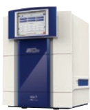
ViiA 7 リアルタイム PCRシステム