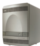
7300リアルタイム PCRシステム