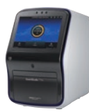
QuantStudio 7 Pro リアルタイム PCRシステム

お見積もり、資料のご請求は、以下のURLまたは二次元バーコードよりご依頼ください。