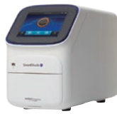
QuantStudio 5 リアルタイム PCRシステム