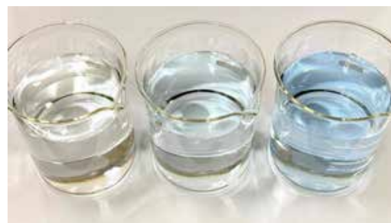
蒸留水 (コントロール)