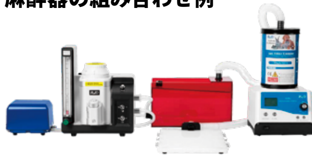
例 1. マスク・麻醉ボックスとの組み合わせ