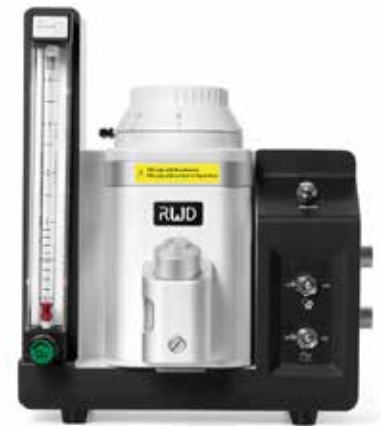
TAIJI 小動物用麻醉器 (セボフルラン)