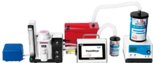
例 3. デジタル式人工呼吸器との組み合わせ