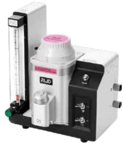
TAIJI 小物用麻醉器 (イソフルラン)