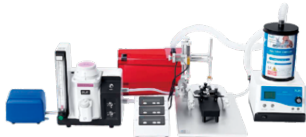
例 2. デジタル脳定位固定装置との組み合わせ