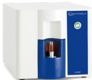
超高感度シングルチューブ ルミノメーター Lumat LB9510