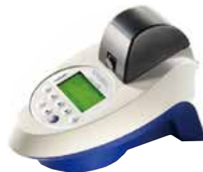
ポータブルシングルチューブ ルミノメーター Junior LB9509